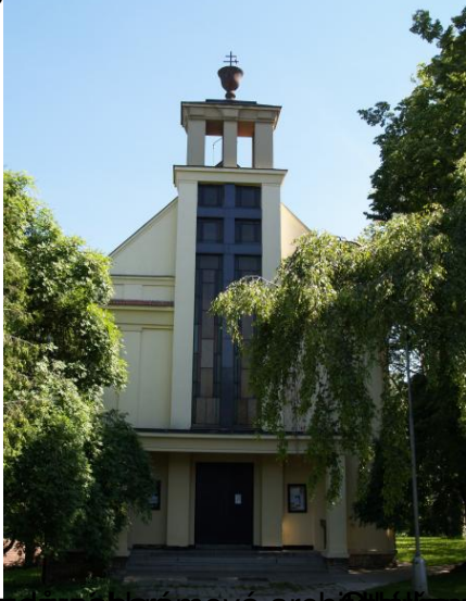
Město nové architektury, která v roce 1937, ná vzhledu výrazem na českou architekturu 20. let