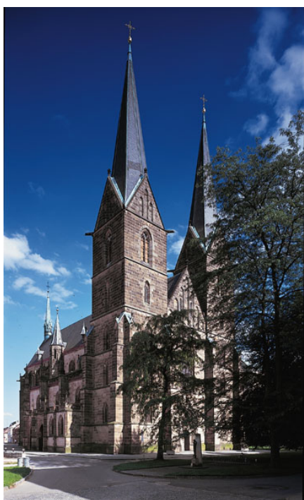
Kostel sv. Vavřince, nám. Otmara Vaňorného. Gotický chrám založený ve 13. stol. Hlavní loď je otevřena v době konání bohoslužeb.

I letos proběhly ve dnech 8. – 16. září Dny evropského dědictví, kdy se v celé Evropě otevřely památky buď zdarma nebo za snížené vstupné, případně byly otevřeny památky běžně nepřístupné. Jejich tématem pro rok 2007 jsou památky, řemesla a lidová kultura . Ve Vysokém Mýtě byly u této příležitosti zpřístupněny uvedené památky, které jsou po skončení Dnů evropského dědictví ve standardním režimu otevřeny nejméně do konce září.