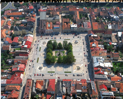
Náměstí Plesnická, která svou monumentalitou, je největším náměstím čtvercového charakteru v