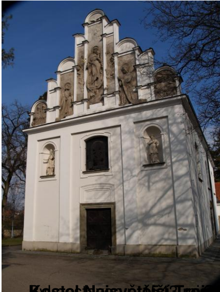
Kyřetel Největší Tříkřížový Pázejeny začal být rozšířen r. 1592 m. 1600 m. 1700 m. K Prazi káje p