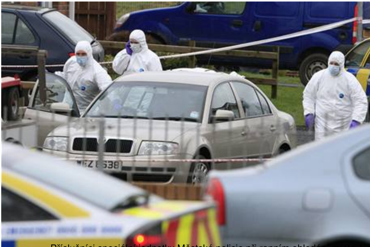
Příslušníci speciální jednotky Městské policie při ranním obhlédnutí místa činu.