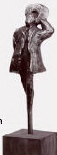
Držitelé výročních cen