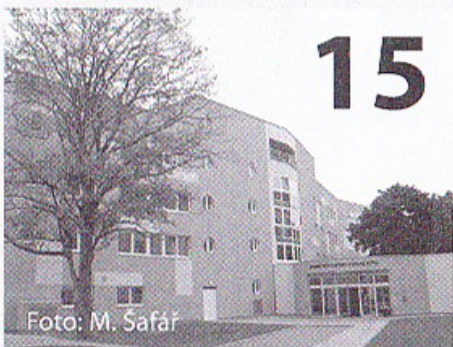
Bohuslav Sobotka navštívil domov pro seniory