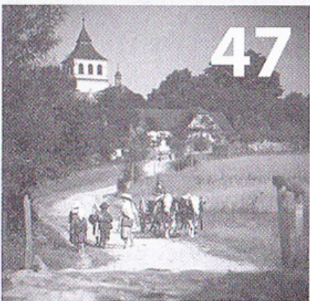
785 let Knířova