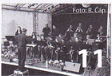
Mezinárodní partnerské dny