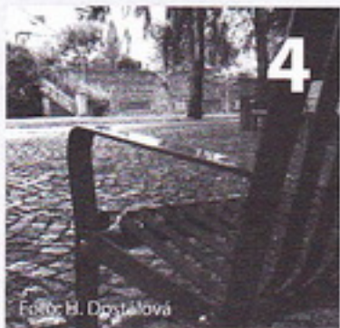
Rozhovor o Jungmannových sadech